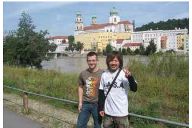
ドイツ留学中、旧友とパッサウ市にて 背景はドナウ川と聖シュテファン大聖堂

若い卒業生の方には、人の幸せのために仕事ができる弁護士は挑戦する価値のある仕事だと思いますのでぜひ目指してみてください。また、卒業生の皆様がお困りの際には、気軽に相談していただければ幸いです。